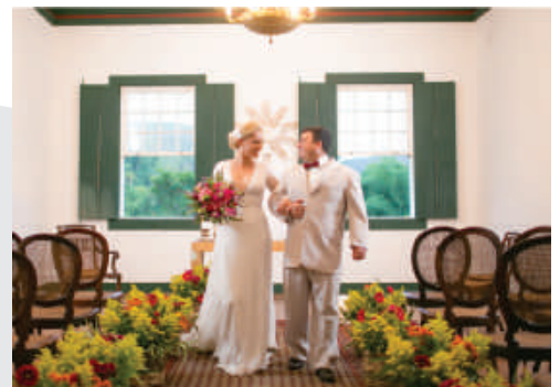
FAZENDA SÃO ROQUE.