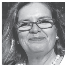
Chef de cozinha, historiadora e pesqui- sadora de gastronomia dos séculos XVIII e XIX.