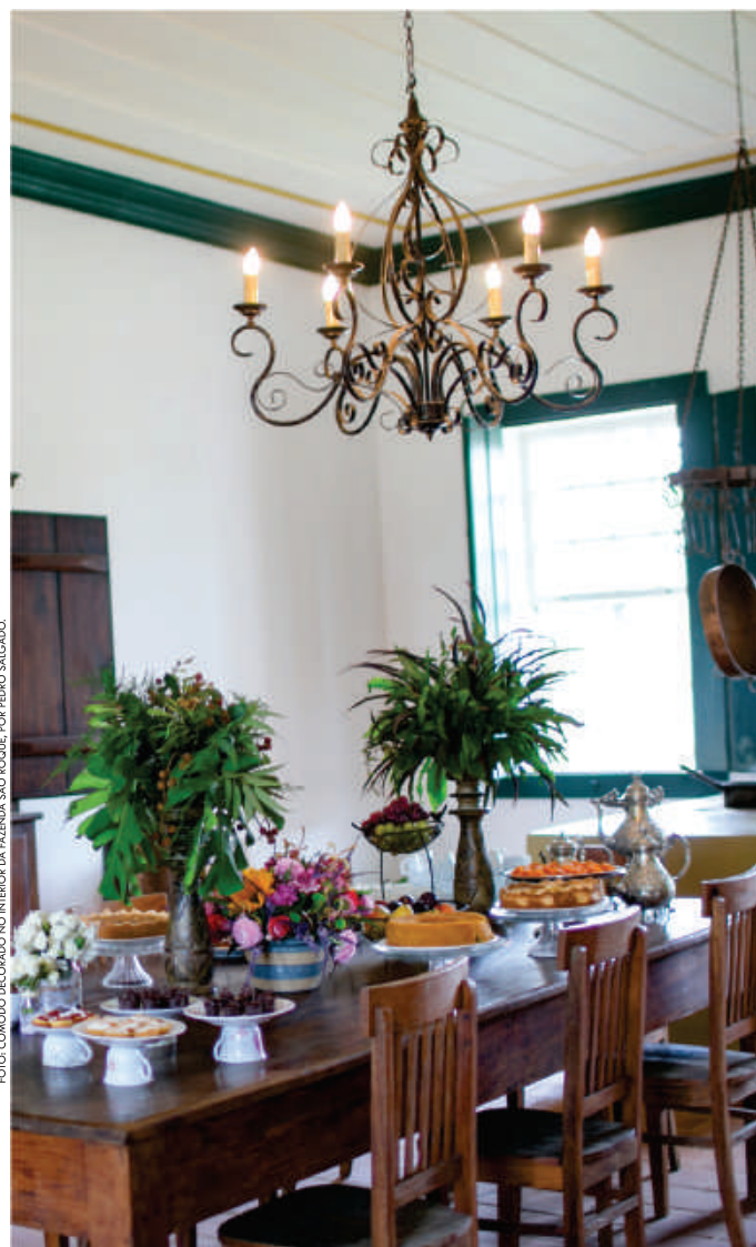
FOTO: COMO O DECORADO NO INTERIOR DA FAZENDA SÃO ROQUE, POR PEDRO SALGADO.

Um grande portão de ferro na entrada separa dois mundos. Quem passa por ele faz uma viagem no tempo e vai parar no Brasil oitocentista, quando o país era o maior exportador mundial de café e o Vale do Paraíba Fluminense o grande responsável por isso.