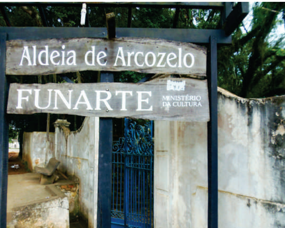
FOTO: ENTRADA PRINCIPAL DA ALDEIA DE ARCOZELO.

A Aldeia de Arcozelo foi interditada em razão de uma ação civil pública ajuizada ano passado pelo Ministério Público Federal contra a Funarte (Fundação Nacional das Artes), que é responsável pela administração do espaço, e também contra a União (Governo Federal) e o Iphan (Instituto do Patrimônio Histórico e Artístico Nacional). A ação exige que sejam adotadas providências relacionadas à conservação da Aldeia, dentre elas, obras emergenciais nos edifícios que compõem o complexo. Exige ainda que sejam tomadas medidas administrativas e judiciais pertinentes à desocupação e à regularização das áreas que hoje encontram-se irregularmente ocupadas.