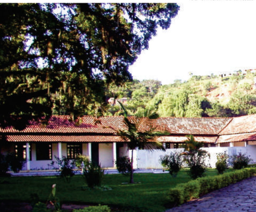
FOTO: VISTA PARCIAL DA ALDEIA DE ARCOZELO.