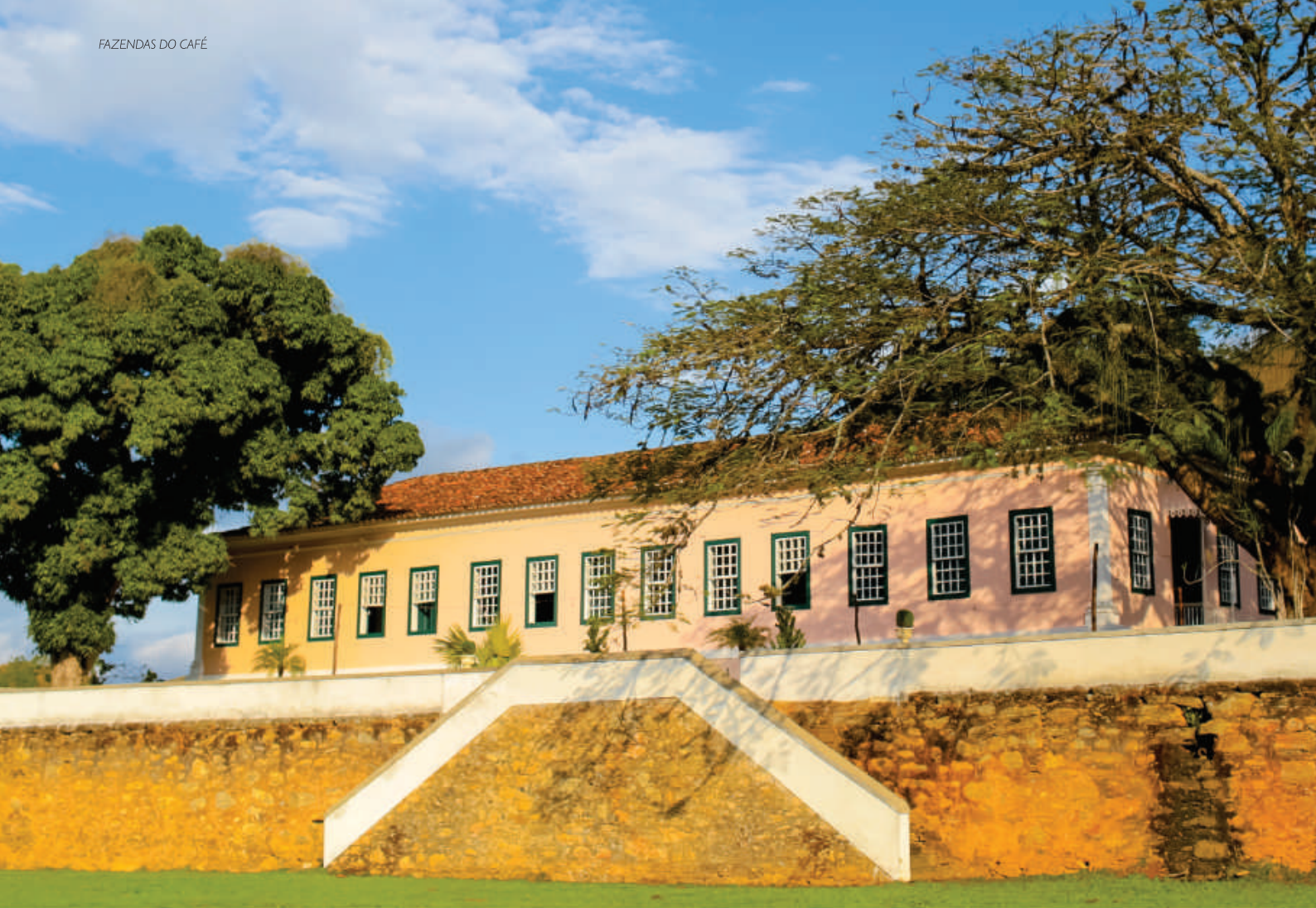
FOTO: VISTA LATERAL DA FAZENDA