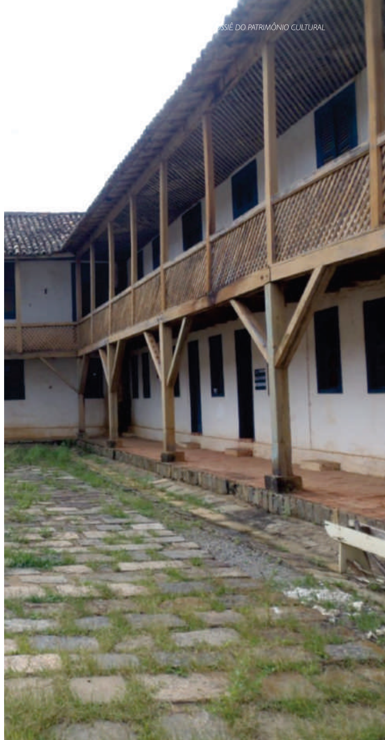
FOTO: PÁTIO INTERNO DA ANTIGA FAZENDA FREGUESIA.