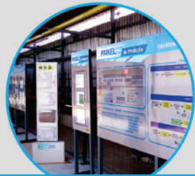
QUADROS DE GESTÃO