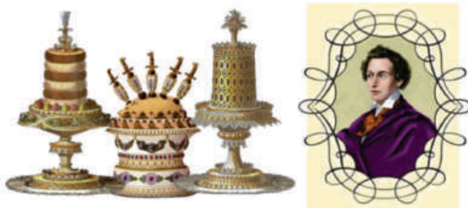
Fonte: Carême - Cozinheiro dos Reis, de Ian Kelly. Jorge Zahar Editora.

Vamos colocar a mão na massa? Até à próxima cozinha histórica e bom apetite!