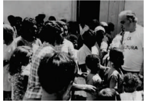
ALDEIA DE ARCOZELO.