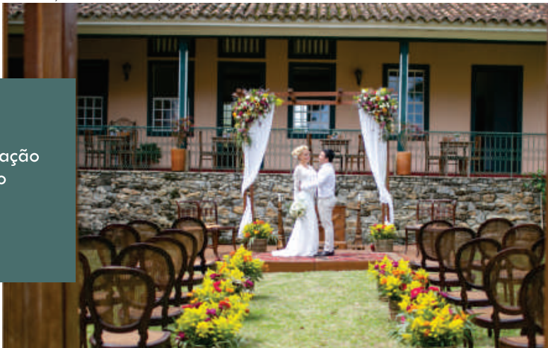
DECORAÇÃO EXTERNA PARA CASAMENTO

Fontes: Informações do Inventário das Fazendas do Vale do Paraíba Fluminense, realizado pelo Instituto Estadual do Patrimônio Cultural (INEPAC); Entrevistas com os proprietários.