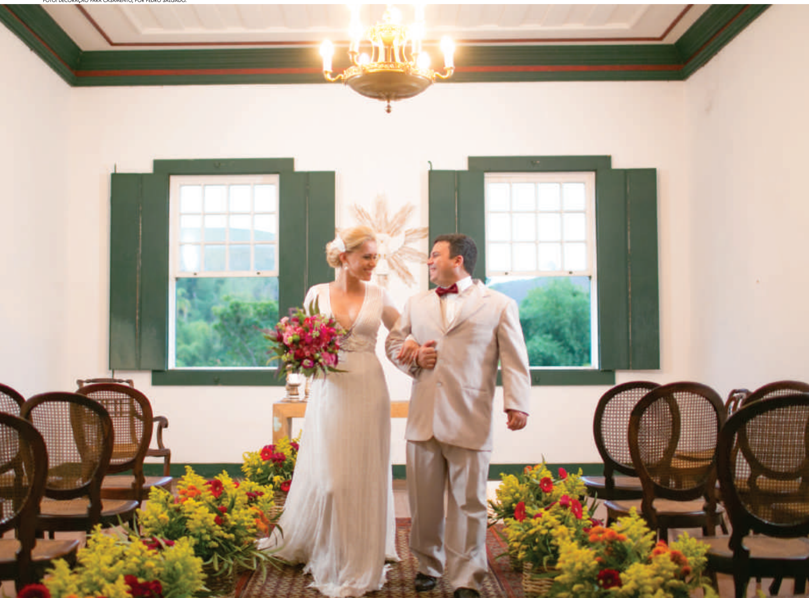
DECORAÇÃO PARA CASAMENTO