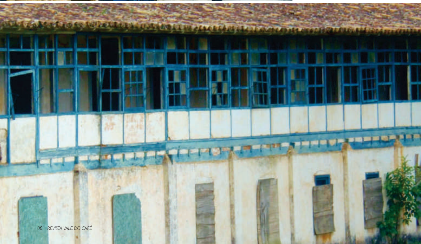
FOTO: UMA DAS FACHADAS DA ANTIGA FAZENDA FREGUESIA.