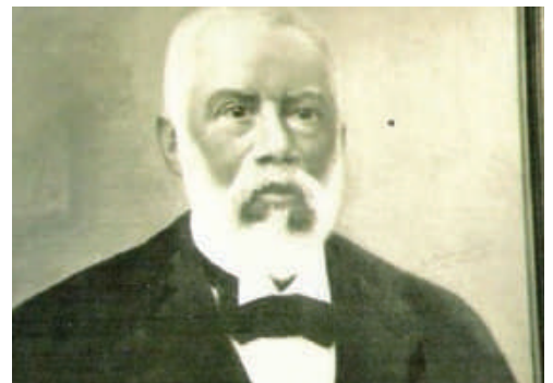
O BARÃO NEGRO.